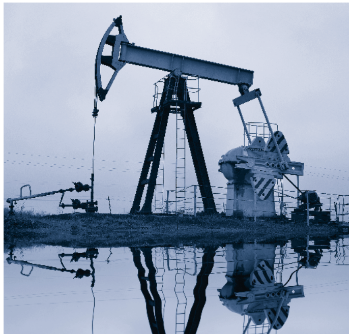
Ölpumpe in Texas