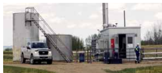
Gasförderanlage der erworbenen Quellen in Bashaw