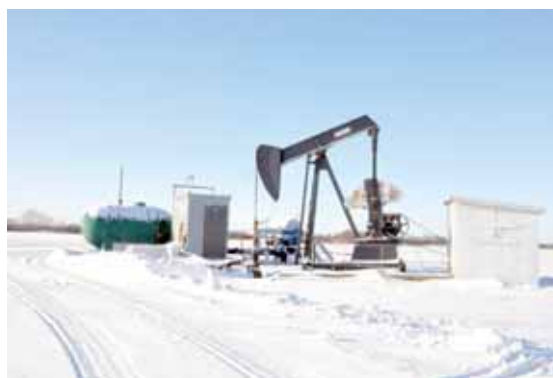
Ölförderanlage im Gebiet Halkirk