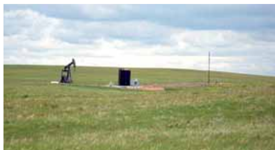
Förderanlage der erworbenen Ölquelle in Claresholm