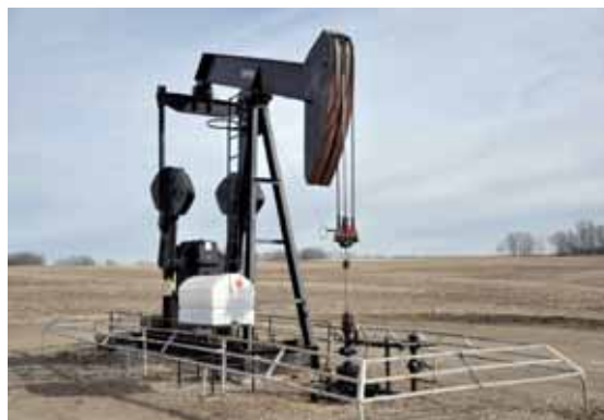
Förderanlage einer Ölquelle im Gebiet Medicine River / Niton