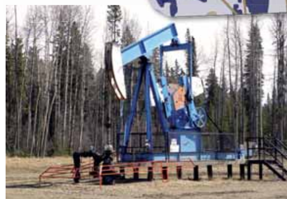
Förderanlage einer Ölquelle im Gebiet Willesden Green