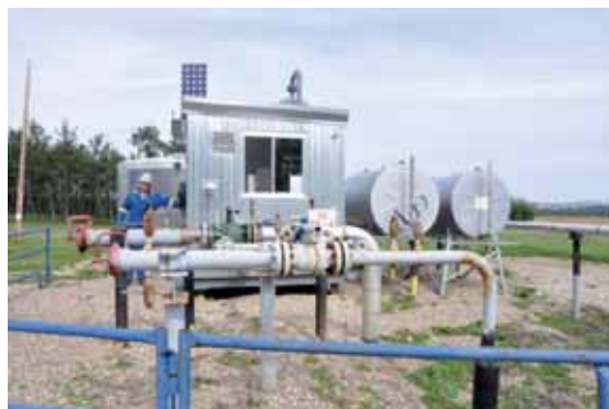
Die Pipelines in Medicine River führen zur abgebildeten Anlage, die das ankommende Gas von Wasser und Kondensat befreit